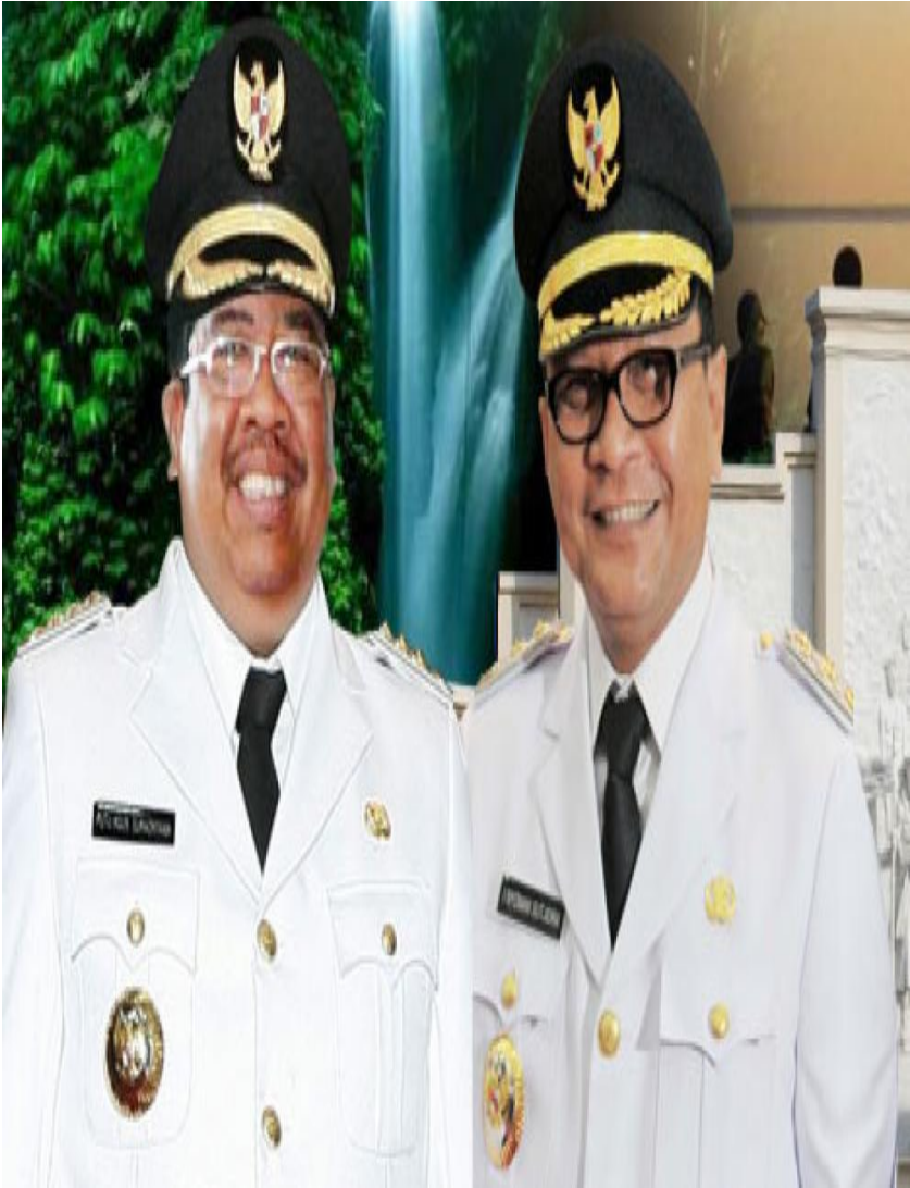
BUPATI BULELENG PUTU AGUS SURADNYANA,ST