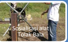
Sosialisasi alat Tolak Bala