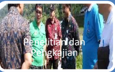
Penelitian dan Pengkajian