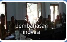
Rapat pembahasan inovasi