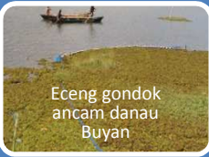
Eceng gondok ancam danau Buyan