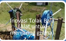
Inovasi Tolak Bala (Alat untuk menjangkit gulma)