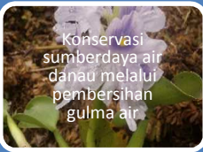
Konservasi sumberdaya air danau melalui pembersihan gulma air